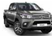
1G3 Сірий 2