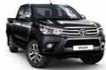
218 Чорний 2