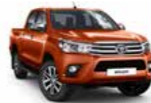
4R8 Оранжевий 2