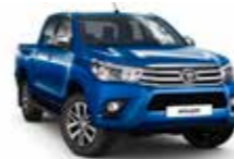
8X2 Блакитний 2

Вся інформація, представлена у цьому матеріалі, є точною та дійсною станом на дату публікації 18.08.2015.