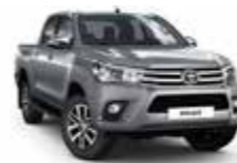
1D6 Сріблястий 2