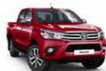
3T6 Червоний 2